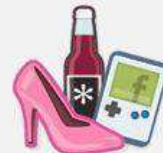
Marke oder Produkt