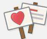
Guter Zweck oder Gemeinschaft