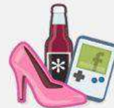
Marke oder Produkt