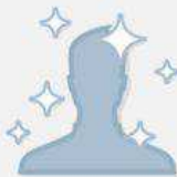
Künstler, Band oder öffentliche Person