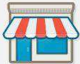
Lokales Unternehmen oder Ort